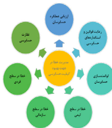
شکل ۱. مدل مفهومی مدیریت خطا در جهت بهبود کیفیت حسابرسی

بر اساس مضامین تعیین شده، مدل مفهومی عوامل موثر بر مدیریت خطا برای بهبود کیفیت حسابرسی به صورت زیر ارائه شده است: