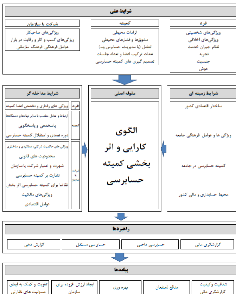
شکل ۱. الگوی ارتقاء کارایی و اثربخشی کمیته حسابرسی (علی‌حسینی، بشکوه و کردستانی، ۱۴۰۱)

حسابرسی از جمله مشغله‌های اعضا (شارما و ایسلین ۱ ، ۲۰۱۲؛ تانی و اسمیت ۲ ، ۲۰۱۵)، تداخل مسئولیت‌های متعدد اعضا (براندز و همکاران ۳ ، ۲۰۱۶؛ خاندکار و همکاران ۴ ، ۲۰۱۶)، دوره تصدی (دالی‌وال و همکاران ۵ ، ۲۰۱۰؛ چان و همکاران ۶ ، ۲۰۱۳) و جنسیت (آدامز و فریرا ۷ ، ۲۰۰۹؛ گل و همکاران ۸ ، ۲۰۱۱)، و در نهایت اندازه و میزان فعالیت کمیته (الوود و گارسیا - لاکاله ۹ ، ۲۰۱۶؛ جبرایل و همکاران ۱۰ ، ۲۰۱۸) را در بر می‌گیرد. افزون بر این رابطه بین ویژگی‌های قابل‌اندازه‌گیری کمیته حسابرسی و اثربخشی حاکمیت شرکتی از طریق سه نتیجه اساسی فرآیند گزارشگری شامل کیفیت حسابرسی داخلی، کیفیت حسابرسی مستقل، و کیفیت اطلاعات مالی، مورد توجه قرار گرفته است (کارسلو و همکاران، ۲۰۱۱؛ غفران و اُسالیوان ۱۱ ، ۲۰۱۳).